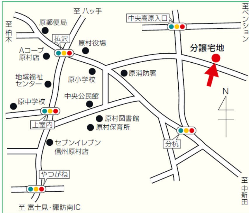
【弘沢上フラワー団地の位置】

二分譲地の位置＝ 中央高原入口信号から 南側へ100mほど進み左折 350mほど進み左側 （「宅地分譲」の看板あり）